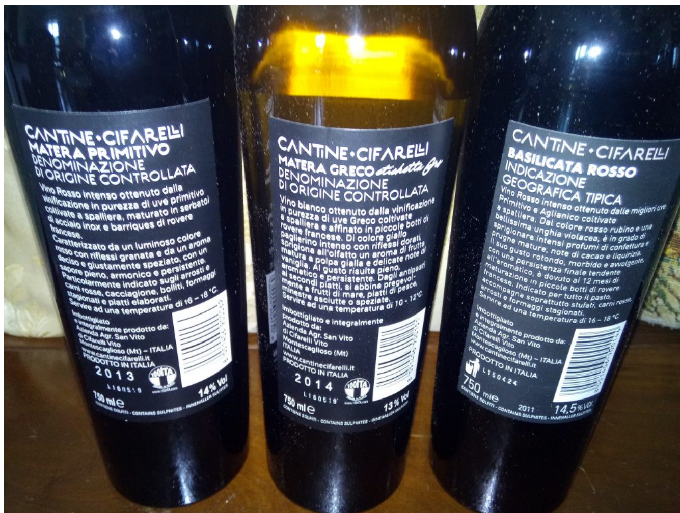
Controetichette Vini Cantine Cifarelli