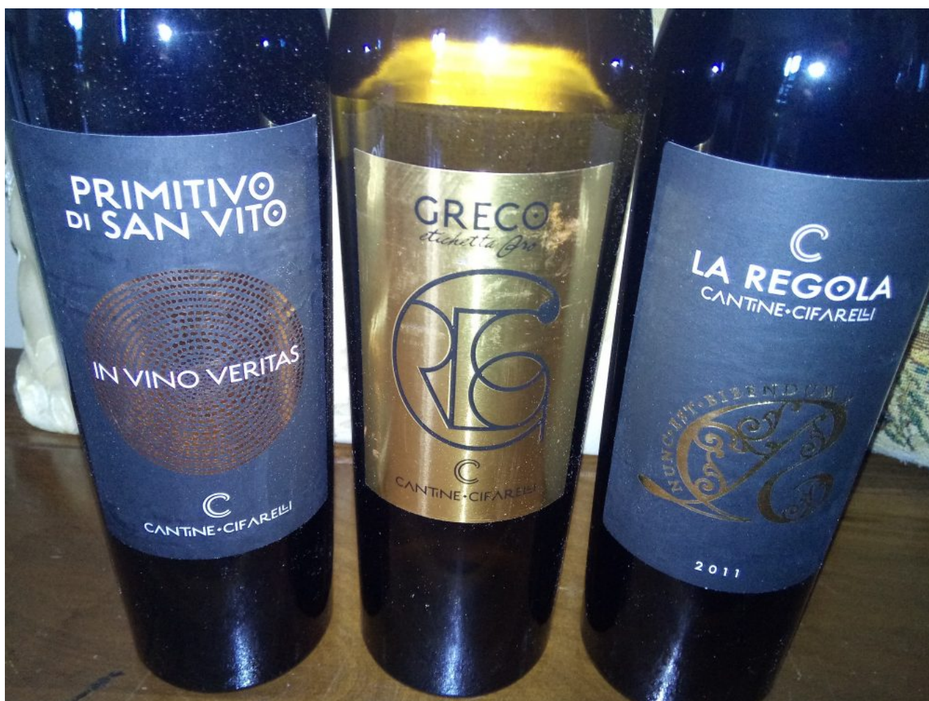
Vini Cantine Cifarelli

26/3/2018 212 Condividi Mi piace 149 Tweet in Condividi G+