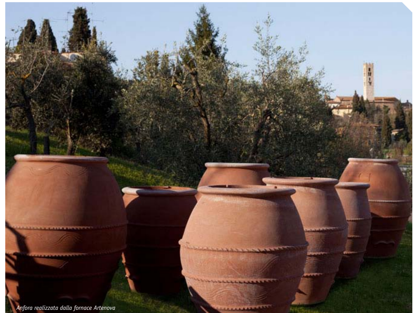
Anfora realizzata dalla fornace Artenova

scoperta la feci: capii che quello non era il mio modo di fare vino. Non volevo un vino alla coca cola, pieno di aromi sintetici. A quel punto non restava che andare alla ricerca dell'acqua pulita. E dove trovarla se non nella storia? La curiosità per il Caucaso mi era già venuta da tempo, da un incontro nel 1984 con Gino Veronelli”. Oggi la cantina Gravner (Oslavia) produce circa 30 mila bottiglie. Tutto vino che passa per le anfore di origine georgiana: 46 in tutto e altre 15 da installare, da 2 mila litri ciascuna. Dopo un anno di anfora il vino passa in dei tini di legno dove quello bianco vi rimane per altri sei anni. Per un totale di sette anni, numero magico secondo Gravner. In questo periodo non vengono misurati né la temperatura, né il residuo zuccherino. “Fare vino è come partorire” dice “l'uomo deve accompagnare e lasciar fare alla natura. La mia idea, infatti, è quella di sottrarre il più possibile: niente additivi, niente lieviti, niente filtrazione. Prossimo obiettivo è eliminare la diraspatura: anche il raspo deve far parte del vino. E in questo ritorno alla natura l'anfora fa il resto: come un amplificatore fa con la musica, l'anfora restituisce un prodotto naturale che ha già preso forma in vigna. Ovviamente non aspiro alla quantità: io faccio vino per me. I numeri non sono il mio mestiere”. >>