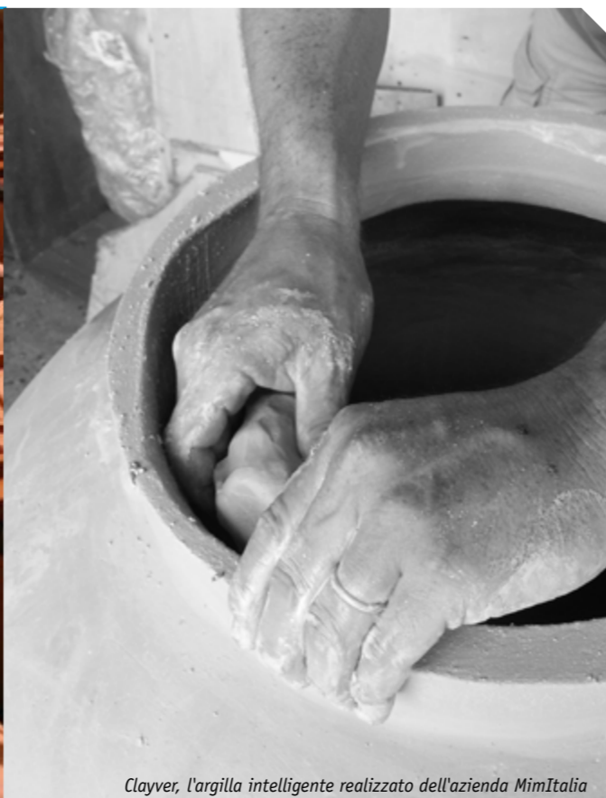
Clayver, l'argilla intelligente realizzato dell'azienda MimItalia